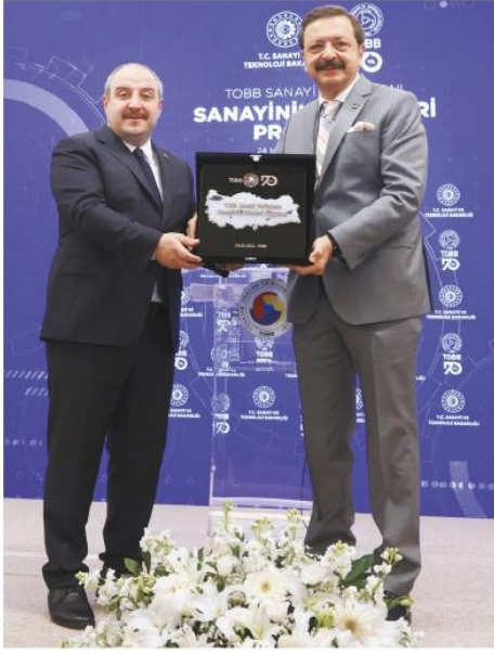
TOBB Başkanı Rifat Hisarcıklıoğlu (sağda), Sanayinin Liderleri Programı Tanıtım Toplantısı'na katılan Sanayi ve Teknoloji Bakanı Mustafa Varank'a hediye verdi.